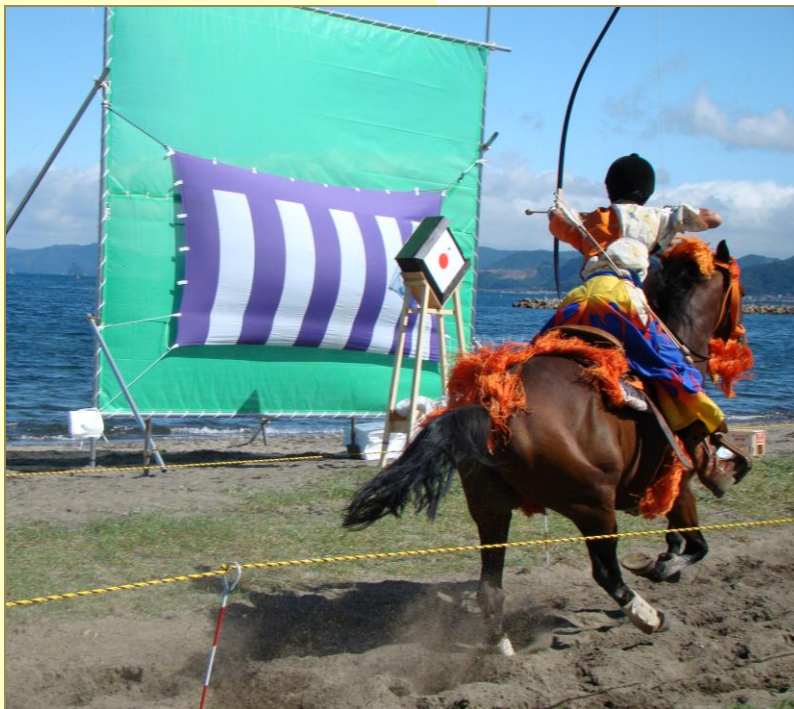
Bild: Der Seitwärtsschuss

Nachdem alle Teilnehmer ihren Lauf durchgeführt hatten und die Scheiben nach vorne um ca. 35° - 40° gedreht wurden, durften wir je einen Schuss nach vorne auf die Scheiben, die eine Seitenlänge von 45 x 45 cm aufwies, abgeben. Bei allen Läufen war es erlaubt den ersten Pfeil vor dem Start einzulegen und man hatte genügend Zeit zum Einnocken.