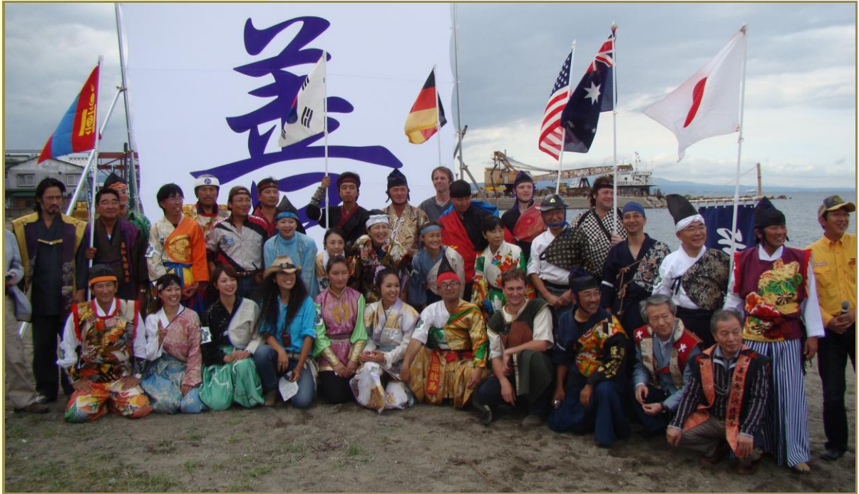
Bild: Teilnehmer des Wettkampfes

In den Tagen nach dem Wettkampf besuchten wir weitere Sehenswürdigkeiten und diverse Reitställe und konnten rechtzeitig und mit viel Glück einer Yabusame Zeremonie beiwohnen. Die Zeremonie wird in einem Waldstück am Tempel der Stadt Hachinohe nur einmal jährlich durchgeführt und somit waren wir zur rechten Zeit am rechten Ort. Glück muss man haben.