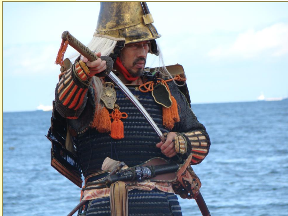
Bild: Samurai beim Einführen des Katana in seine Schwertscheide

Da uns die Vorführung gefallen hatte, durften wir den „Samurai“ am nächsten Tag einen Hausbesuch abstatten und er zeigte uns diverse Stücke seiner Schwertsammlung. Dies war ein außergewöhnliches Erlebnis.