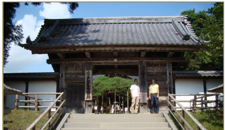
Bild: Gate of Tsunagi Temple

Entsprechend unserem Wunsch übernachteten wir in klassischen japanischen Hotels mit heißen Quellen (Hot Spring) und Schlafmatten auf Tatami-Böden. Nicht nur die Einrichtung war japanisch geprägt, sondern auch das Essen, welches aus Sushi, Fisch in allen Variationen, verschiedenen, in Deutschland unüblichen, Gemüsesorten und natürlich Reis zu jeder Tageszeit bestand.